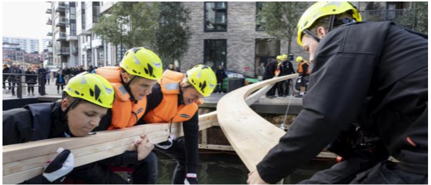
Brobyggerne skal knokle for at få broen på plads

Bydelsforeningen holdt den 21. marts 2022 dialogmøde med over