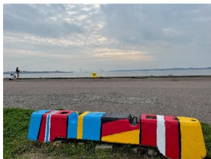
Gå en tur langs Esplanaden og se alle de flot udsmykkede klodser

Udgangspunktet har været signalflag fra den maritime verden, og her har eleverne hentet inspiration fra et af Kanalbyens permanente værker, "Kajens Grammatik".