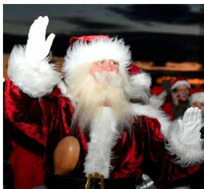
Den 17. november ankommer julemanden. I år skal den gamle brandbil køre ham

Fredag den 17. november kl. 16.45 spiller 6. Juli Garden på Gl. Havn, mens vi venter på, at Julemanden ankommer med skib kl. 17:00.