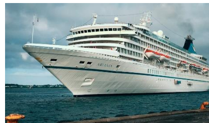
Artania kommer to gange i december

Tirsdag den 19. december kl. 09:00 – 20:00 – Artania